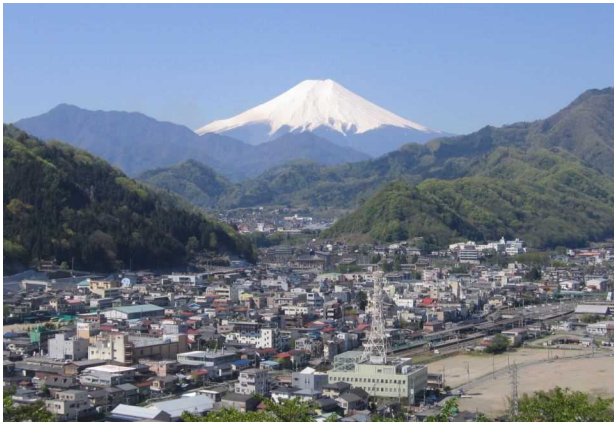
富士山と大月市街地