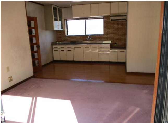
キッチンとリビング