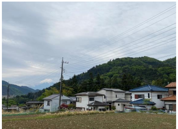
自宅付近から見える富士山