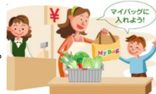
ノーレジ袋推進運動