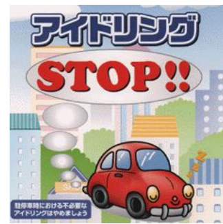
アイドリングストップ運動