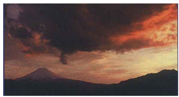
百蔵山からの富士山

4月、11月 “桜”の時期と“紅葉”の時期がお勧めです 標高：1003.4m 所要時間：約5時間 Mt.Momokurayama 百蔵山