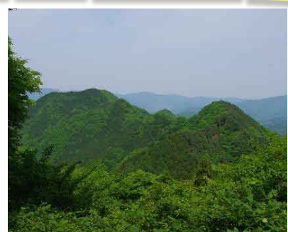
■新大地峠方向から歩くと高柄山の形がよくわかります