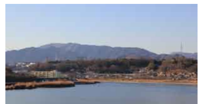
■上野原駅に至る手前、桂川と上野原の台地、権現山等が望めます