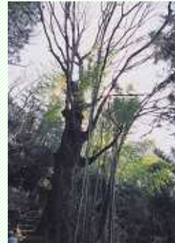
無辺寺のトチノキ

樹高22m、根本の周囲4.5m、目通周囲4.3m、枝下1.5m。幹にはトチノキ特有の渦巻き文様が見られる。市の文化財に指定されています。