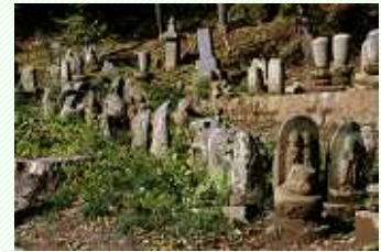
法雲寺の写(うつし)観音霊場

各観音霊場に見立てた石仏を配置しこれを礼拝するための、観音霊場めぐりのミニチュアのことであり、現在、観音山には175体の石仏が確認されています。