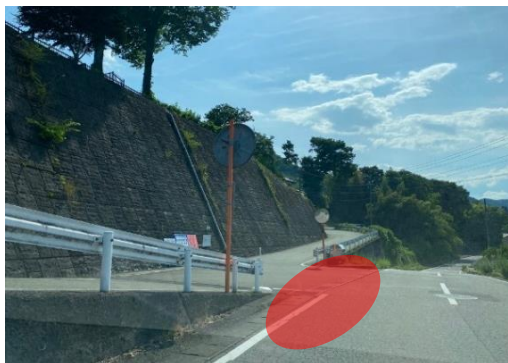
小篠地区入り口付近