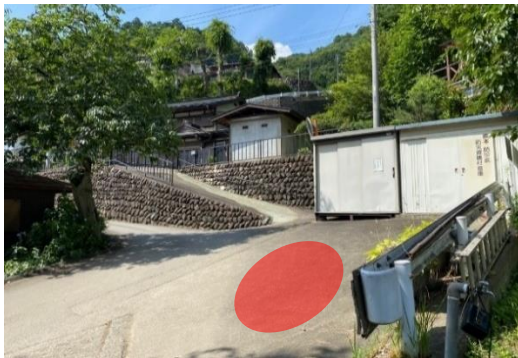
綱本ゴミ集積所付近