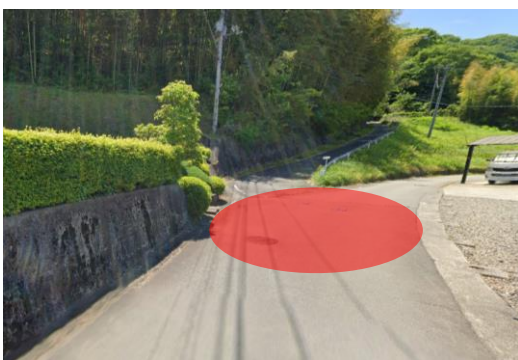
民宿やまみち付近