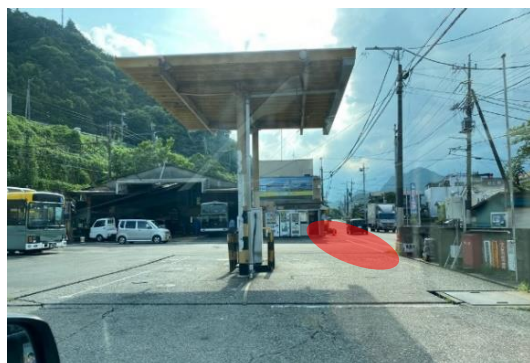
富士バス猿橋営業所前