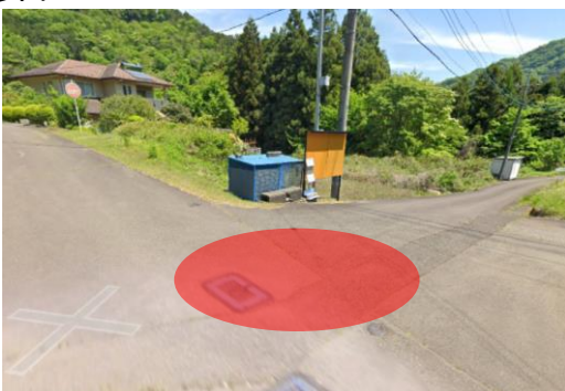
ゴルフ練習場(桑原)