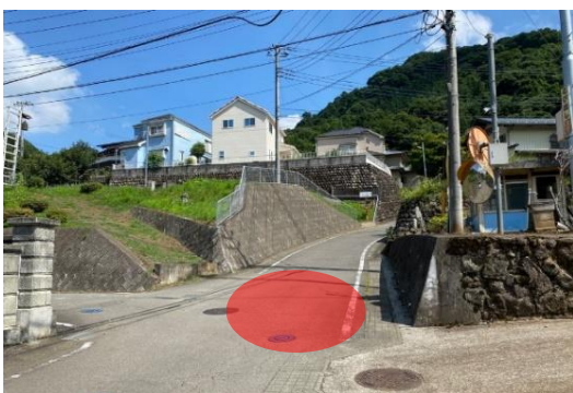
集いの家入口付近