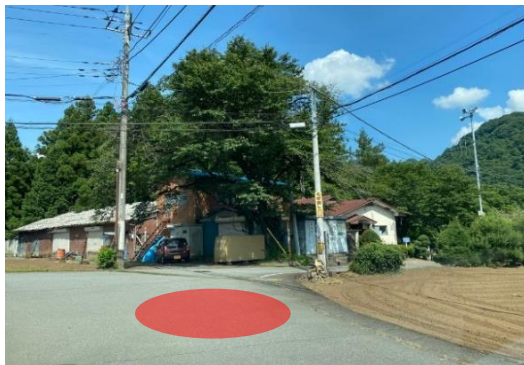
原集会所横ゴミステーション付近