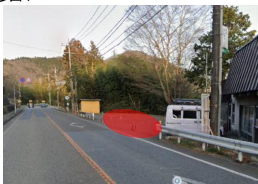
斧窪西バス停付近