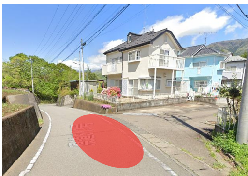
下畑西側住宅地入り口