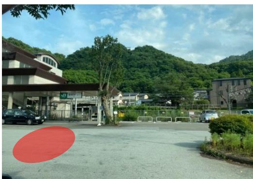
猿橋駅ロータリー