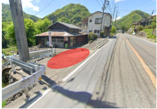
綱本ゴミ集積所付近