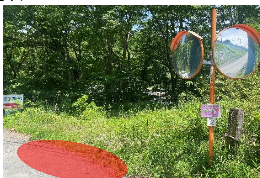
カルバートをくぐった先