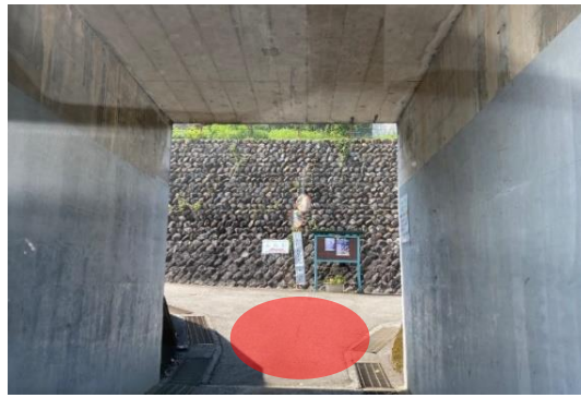
カルバートをくぐった先