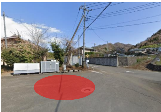
塩瀬中下組ゴミステーション付近