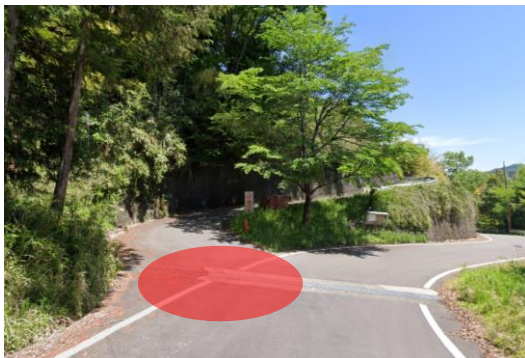
ウエマギ地区入口付近