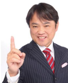
山梨・大月生涯青春大学プロジェクト プロジェクトコーディネーター