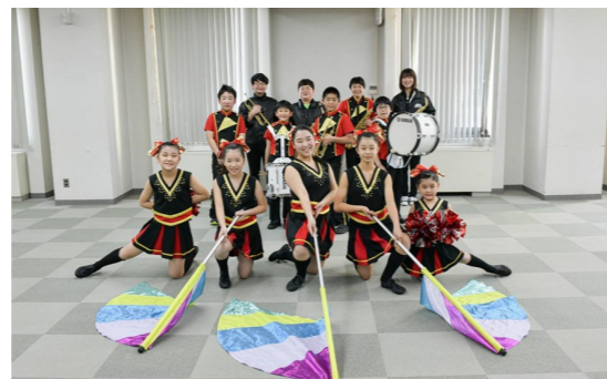
レインボーKIDSのメンバー