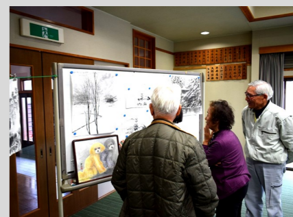
それぞれの作品を見て