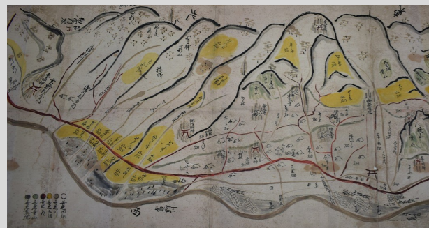
江戸時代の葛野地区の地図

・地域の歴史が知りたいと思い参加しました。昔の地域のこと、昔の歴史が繋がってきて、おもしろいです。(男性) ・元々、この生まれではないので、こういった話を聞きたくて参加をしました。地元で生まれ育った夫と、色々な話をするのが出来るようになりました。(女性)