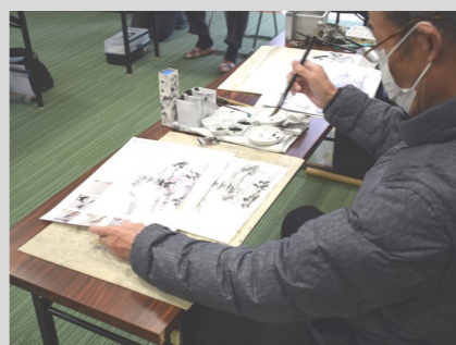
ひとつひとつの丁寧な筆運び