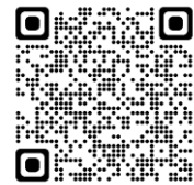
新型コロナウイルス感染症に関する相談窓口