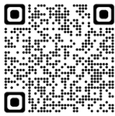
山梨県救急医療情報センター

緊急性がなく、ご自身で病院に行ける場合は交通機関を利用するなど、救急車の適正利用にご協力をお願いいたします。