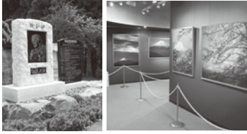
八番 お伊勢山 白旗史朗顕彰碑 八番 岩殿山 白旗史朗写真館